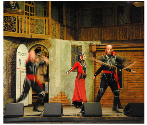
Fredsbro og nytt konserthus i Tbilisi