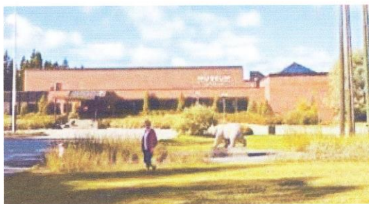
Norsk Skogmuseum på Elverum. (google)

Kl. 13.00 blir det omvisning på Glomdalsmuseet hvor vi bl.a. får se Latjodromen (Tatermuseum).