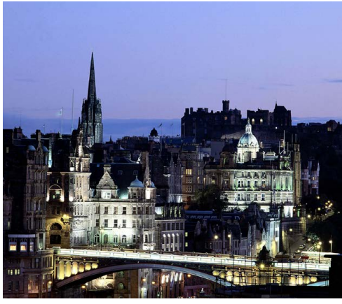
Edinburgh - Skottlands hovedstad