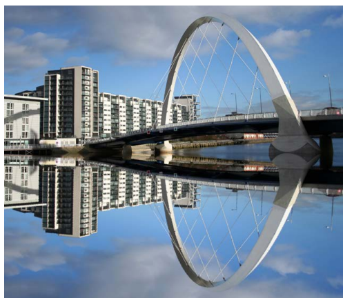
Moderne landemerke i Glasgow