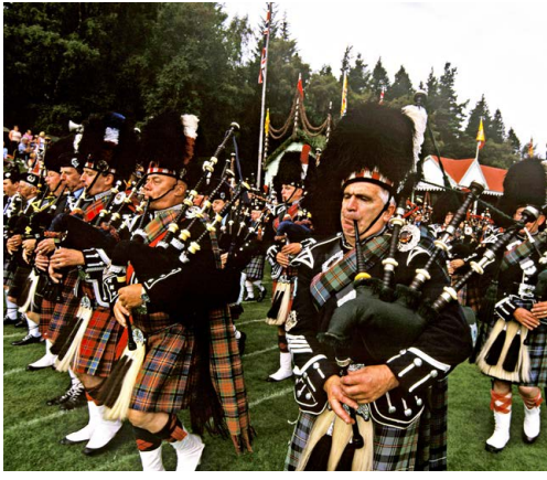
Klaner og tradisjoner står sterkt