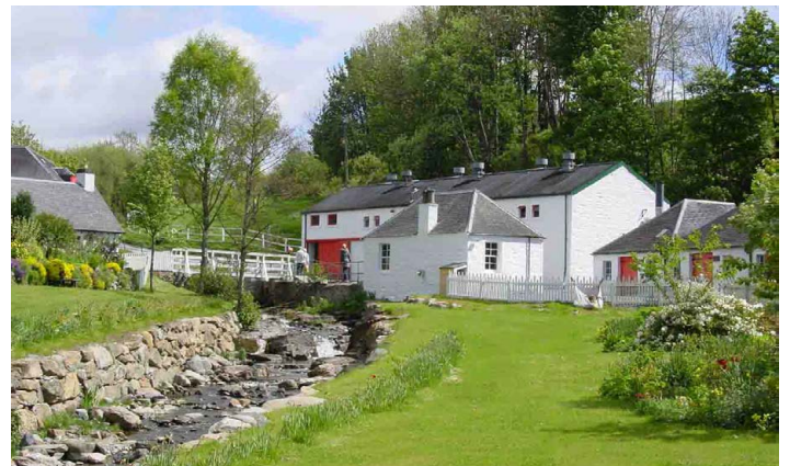
Edradour - Skottlands minste whiskydestilleri

I dag har du fortsatt tid til å nyte de landlige omgivelsene rundt hotellet før avreise, og vi spiser felles lunsj på hotellet før bussen går tilbake til flyplassen i Aberdeen. Vår opplevelsesrike tur til nabolandet i vest er over, og med hjem tar vi gode minner og flotte fotomotiv og kanskje noen gode lokale produkter.