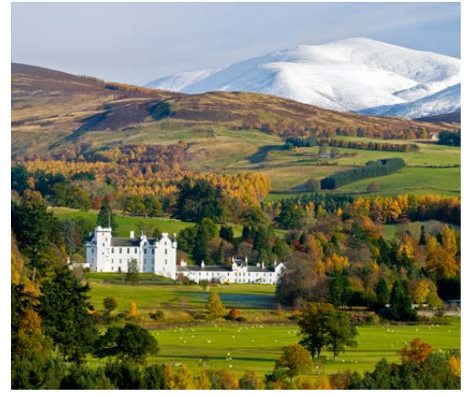
Blair Castle - et av de fineste

parken, med fjell opp mot 1000 meter. Utsikten fra vinduet skuffer ikke, de utallige grønnnyansene er behagelige for øyet. Den verneverdige miniputt-landsbyen Luss består av noen bitte små dokkehusaktige hytter, hager som i et eventyr og en hjemmekoselig kafe med butikk. Etter lunsj stopper vi på et stort ullsenter som også driver med oppvisning av fårehunder samt jaktfugl. Vareutvalget her er særdeles godt, så det er vanskelig å komme tomhendt ut! Utpå ettermiddagen kommer vi frem til den koselige og pittoreske byen Dunkeld som skal være vår base under resten av oppholdet. I tillegg til noen flotte butikker, puber og en katedral som minner om Nidarosdomen, finner du Skottlands største og eldste trær her. Hotellets restaurant byr på flott utsikt over elven og serverer tradisjonell skotsk mat basert på førsteklasses skotske råvarer som biff, laks og lam.