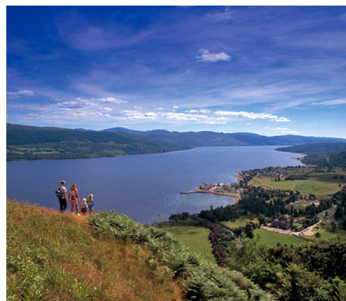
Vakkert landskap ved Loch Lomond