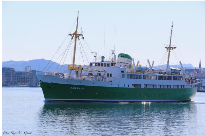
MS Sandnes - nattrutten