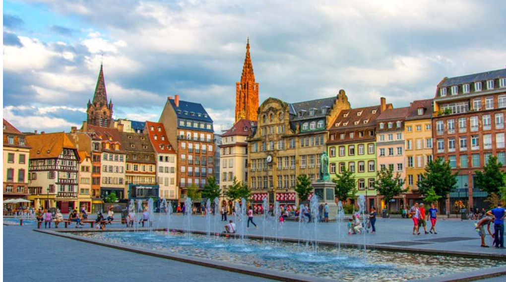
Place Kléber i Strasbourg

Tidlig kveld legger vi til kai i Rüdeshheim, en sjarmerende liten by omgitt av vinmarker. Her kan du ta en spasertur gjennom byen sammen med reiselederen eller på egen hånd. Byens hovedgate, Drosselgasse, er kjent for sine pittoreske bindingsverkshus, livlige atmosfære og mange små kneiper og tavernaer. Ta en pause for å smake på den lokale vinen eller byens spesialitet – Rüdeshheimer kaffee.