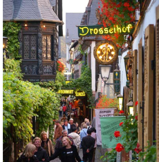
Drosselgasse i Rüdesheim