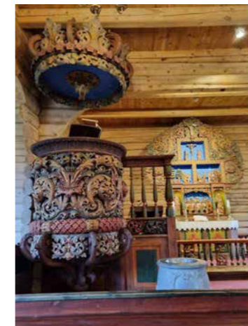
Interiør frå kyrkja

Ein blir aldri trøyt av å kjøyre den kronglute vegen til Skåbu, med skue ut over den avgrunnsdjupe dalen, med elva så langt nede at ein berre kan undrast, og med flotte gardar trass i ein oftast bratt og tungdreven jordveg. SKÅBU, som ligg 870 moh og er det mest høgtliggjande bygdesamfunnet i landet, har ei historie heilt attende til vikingetida, med eit avbrekk på ca 300 år frå Svartedauden til 1600-talet. Namnet stammar frå den norrøne gudinna SKADE, gudinna for jord, vinter og ski. Første stoppen vår var ved kyrkja, ei tømmerkyrkje frå 1927, bygd med ein enorm dugnadsinnsats av bygdefolket sjølve. Marit Håkenstad ynskte oss velkomne og overlet ordet til Unni Bøyum Kluge, ei sers engasjert dame, som har tapt hjertet sitt til bygda og kyrkja. Den særeigne treskurden i kyrkja er utført av treskjæraren Per Haugen frå Vågå. Inspirasjonen frå gamle meistrar i dalen, som Jacub Klukstad og Skjåk-Ola er tydeleg, medan Haugen sitt uttrykk er endå meir kraftfullt, og med fargar som speglar naturen.