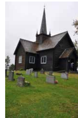
Skåbu kyrkje frå 1927

I slutten av august dro 20 medlemmer av LOP Gudbrandsdal på dagstur til Skåbu og Sikkildalen. 25 var påmelde, men fem vart av ymse grunnar avmelde. Vi kjørte i privatbilar, og vëret var både grått og litt vått, men det påverka ikkje stemninga, da opplegga var innadørs og interessante (som vanleg).