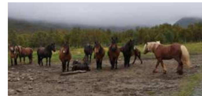
Hestane i Sikkildalen