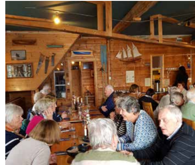
Frå Hallvardsnaustet. Det brune oppe på veggen til venstre er modell av livbåtene dei laga når det var båtbyggeri her.