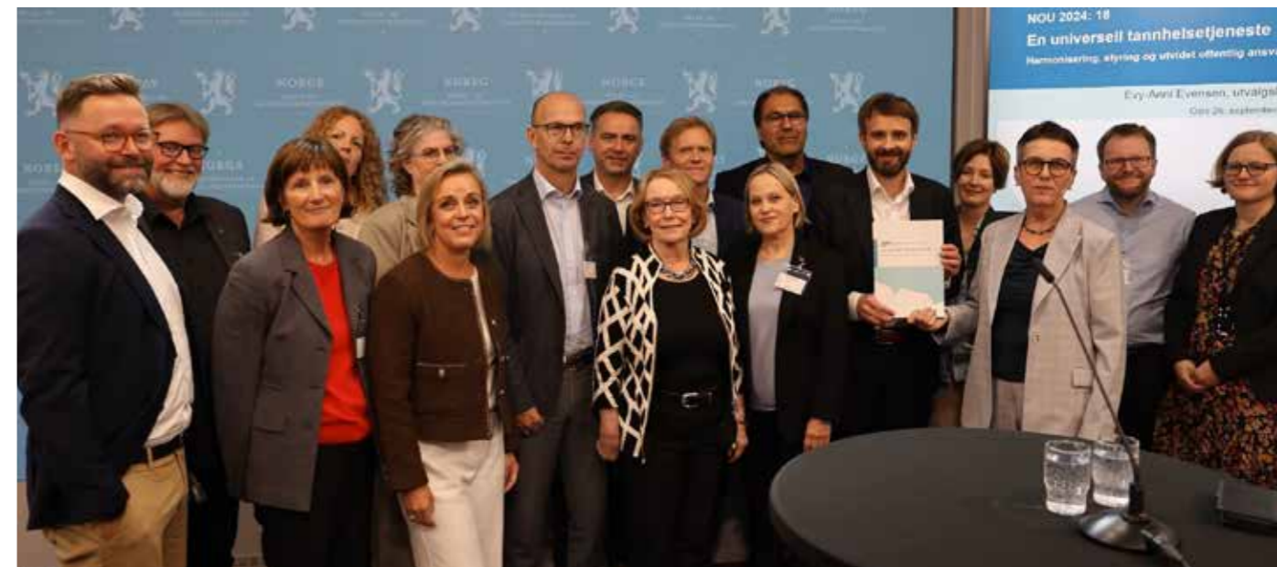
26. september 2024 overleverte tannhelseutvalgets 13 medlemmer sin rapport til helse- og omsorgsminister Jan Christian Vestre.

– Det har vært et svært interessant arbeid sammen med mange dyktige utvalgsmedlemmer. Arbeidet har strukket seg over to år, og noe av dette arbeidet har også dreid seg om å lage et godt kunnskapsgrunnlag for framtidige beslutninger. Den første tiden brukte vi som utvalg blant annet til å finne kunnskap, bestille utredninger og gjøre sammenligninger med andre land.