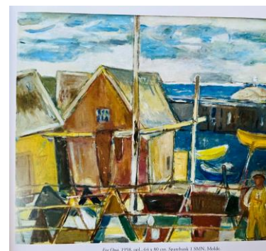
Fra Ona, 1958