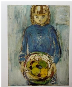
Gøril med fruktfat, 1953