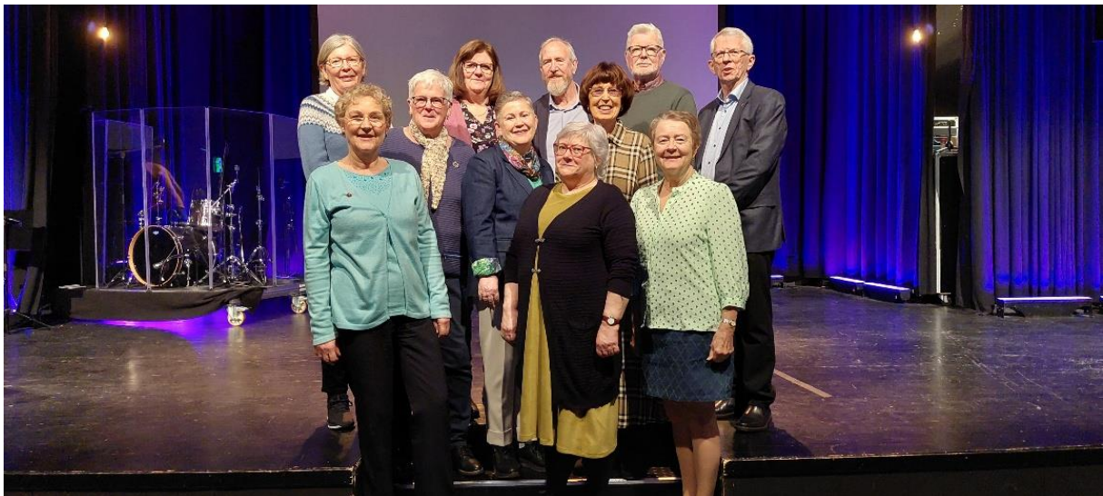
Styret i LOP Rogaland Sør 2024.

Vi i styret setter pris på innspill, tilbakemeldinger, ros og ris. Ta gjerne kontakt!