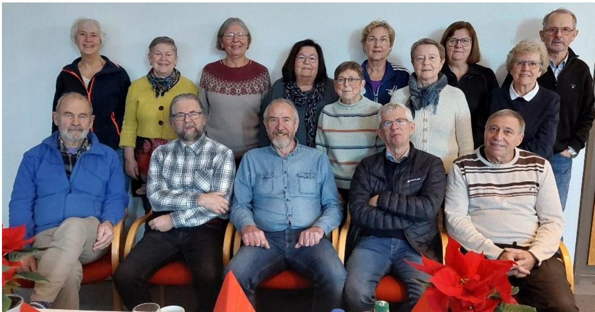
Førjulsfesten i en festpyntet festsal i Klepp rådhus 29. nov -23, samlet 170 medlemmer. Her er styret i LOP RS, sammen med velvillige hjelpere, ferdige med å rigge til.